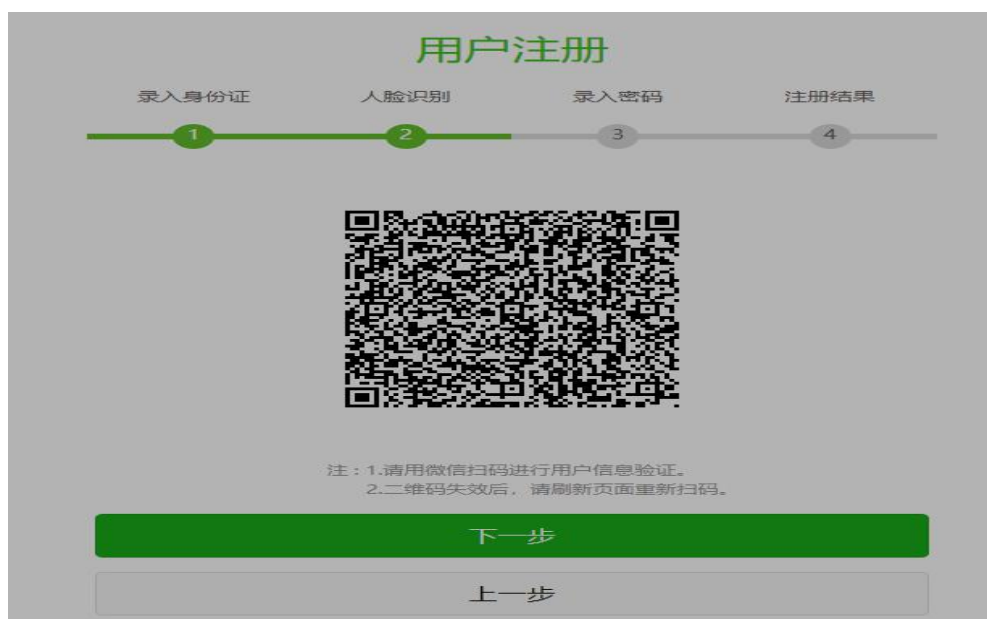
人脸核身二维码页面

在人脸核身页面，如果您是通过电脑端打开的网页进行操作，请用手机中的微信程序扫描二维码；如果您是直接通过访问微信公众号进行操作，则在此页面按住二维码，然后选择识别图中的二维码，如图示：