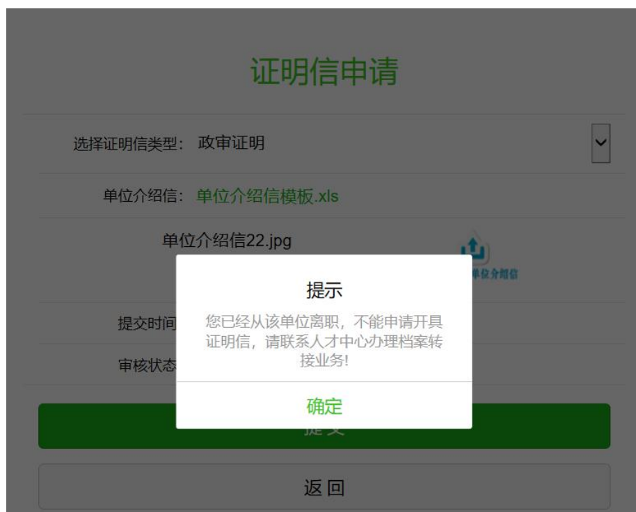
从单位离职后提示信息

如果您的存档性质是单位存档，并且已从单位离职，系统登记了解聘时间，则申请提交开具证明时会提示‘您已经从该单位离职，不能申请开具证明信，请联系人才中心办理档案转接业务’。如图示：