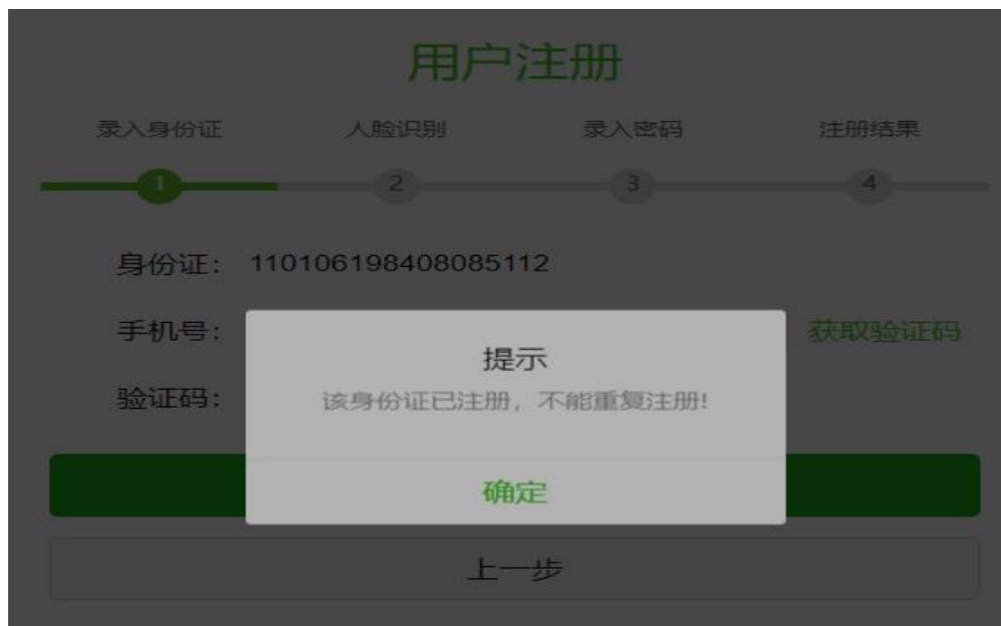
身份证重复注册提示

如果您输入的身份证号之前已经注册过，在输入身份证号码后，点击下一步或是获取手机验证码时，系统会弹出‘该身份证已注册，不能重复’的提示，请直接再登录页面输入身份证号码和密码登录即可。如下图：