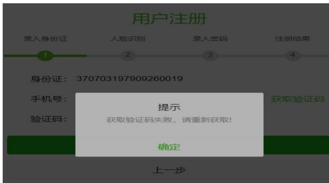
手机号码输入错误提示

如果输入的手机号码不是正确 11 位手机号，系统会提示‘获取验证码失败，请重新获取’提示，请输入正确位数的手机号码后再重试即可。如下图：