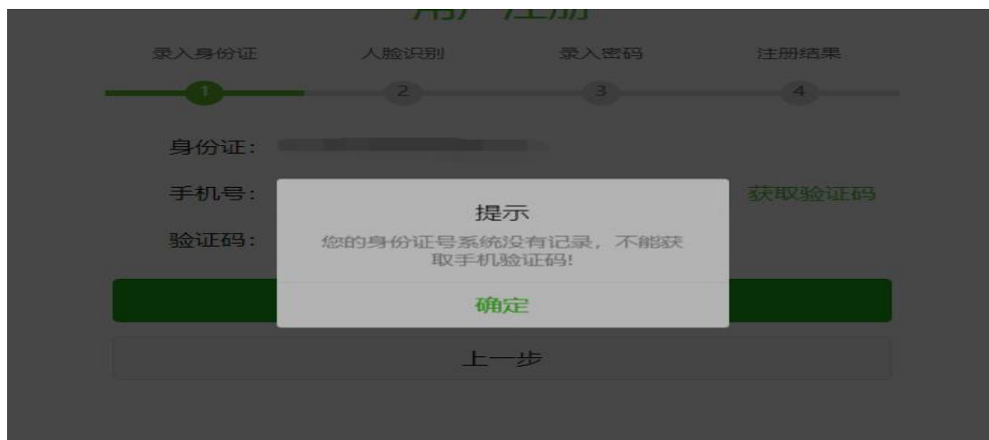
身份证号验证提示

注册时输入本人身份证号（ 请务必输入本人身份证号码，系统会通过身份证号校验档案是否在档 ），以及本人手机号码进行注册（ 手机号码请务必输入本人的手机号码，用于以后忘记密码后找回密码 ），当输入身份证号码时，系统如提示‘您的身份证号码系统没有记录，不能获取手机验证码’时，说明输入的身份证号码信息错误，请核实输入的身份证号码信息是否正确，如果确认身份证号码输入无误，则说明您的档案不在人才中心，此时便不能继续进行注册操作。如下图：